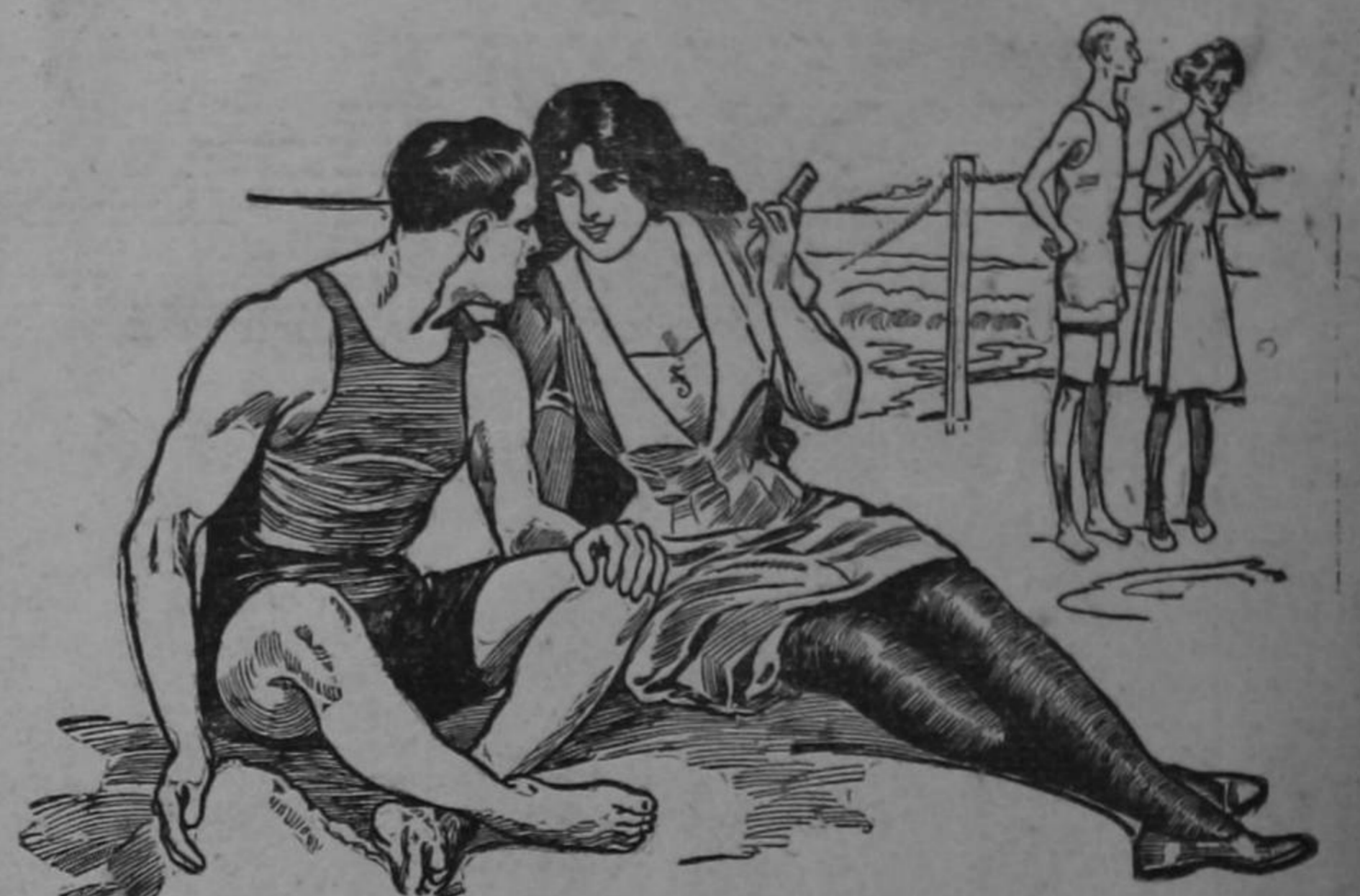
Fíjate en aquel par de raquiticos. ¿Por qué no tomarán Sargol para engordar?